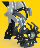
Eisen-Andruckrolle mit Fingerprofil