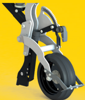
FarmFlex Andruckrolle mit W-Profil