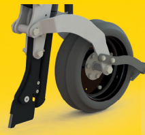
Schar für minimale Bodenbewegung